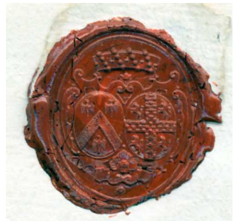
Sceau au verso

à la ville du bois près dieppe, ce 27 fevrier 1757.