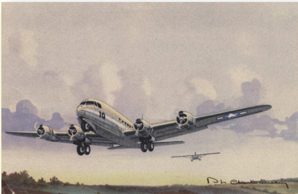
DOUGLAS SKYMASTER C-54

Jean-Luc TRASSAERT, in L'ECHO DE LA TIMBROLOGIE, janvier à avril 2001