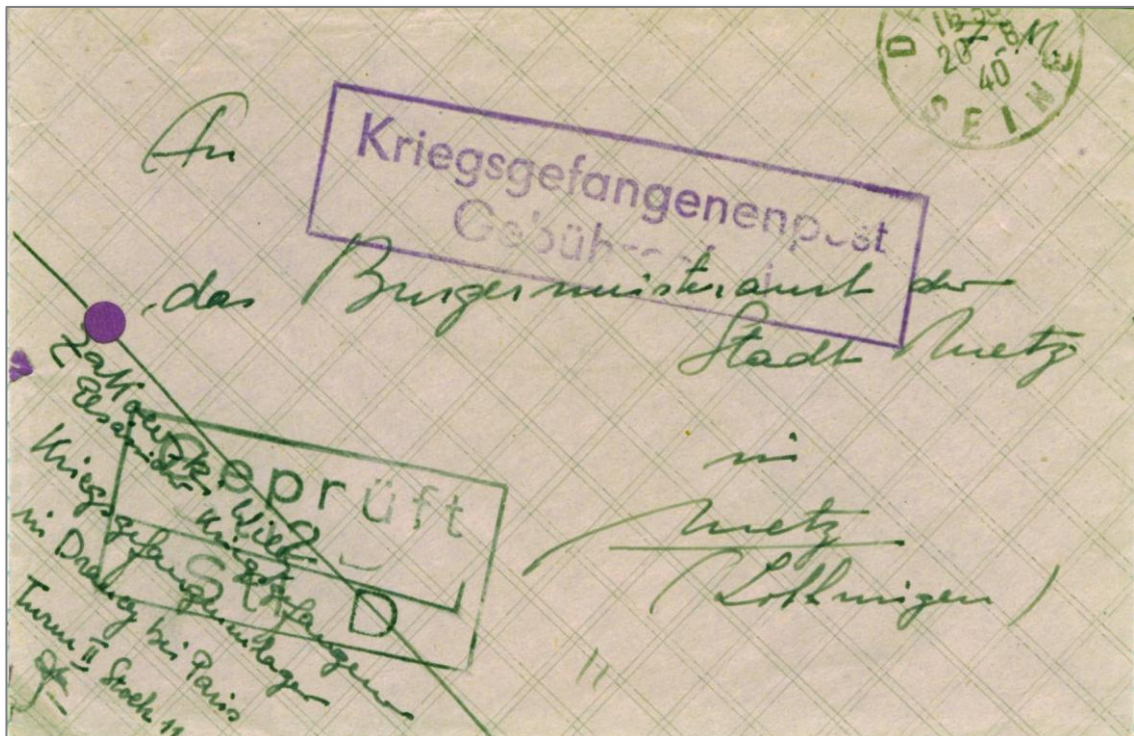
Fig. 1 - Lettre du FRONT-STALAG 111, à DRANCY, le 20 août 1940 à destination de la Mairie de METZ

Kriegsgefangenenpost (Poste des Prisonniers de Guerre) Gebührenfrei En franchise)