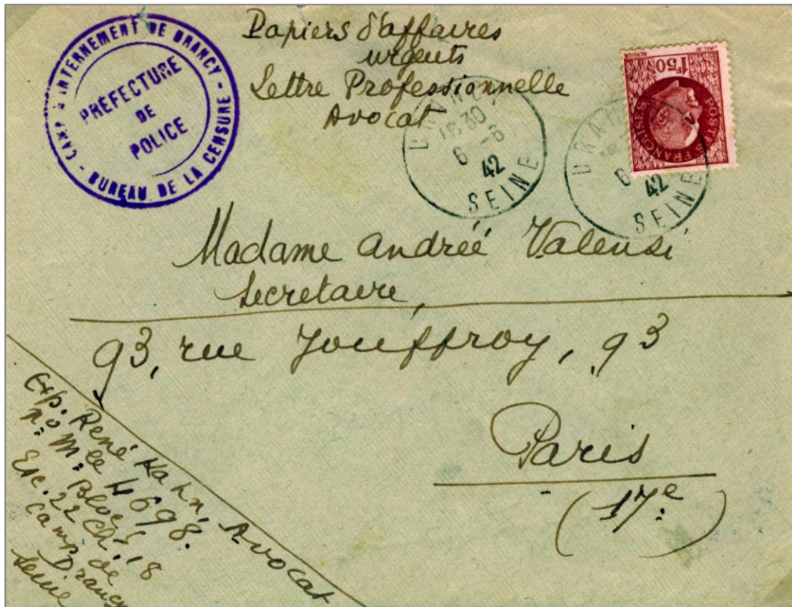
Fig. 4 - Lettre du CAMP D'INTERNEMENT DE DRANCY du 6 juin 1942 pour PARIS

Majoritairement immigrés, 70.000 Juifs passeront par DRANCY. 67.000 d'entre eux seront déportés vers les camps de la mort d'où 2.000 à peine reviendront. (Fig. 4)