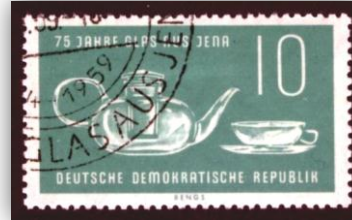
Modèle en verre d'Allemagne.