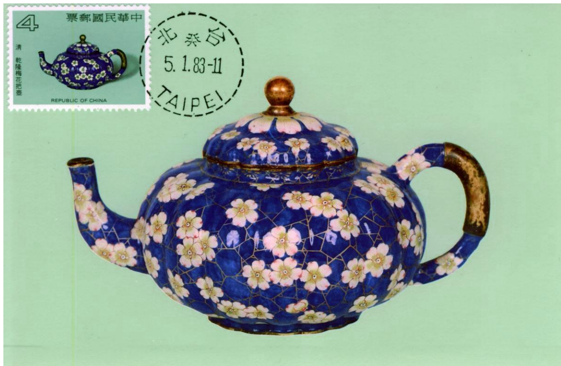
Théière au décor de fleurs de prunier. Dynastie Qing – période Qianlong (1736-1795).