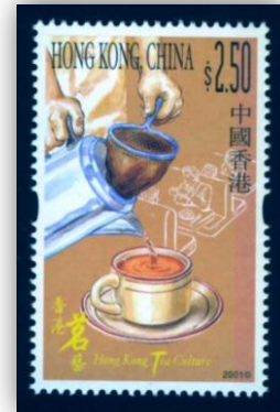
Thé au lait - de Hong Kong.