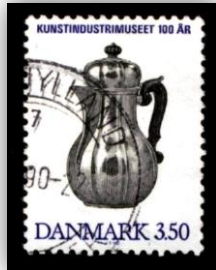
Modèle en métal du Danemark.

En matière de théière, l'Europe fait montre d'une belle diversité. En voici quelques exemples.