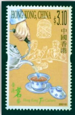
Yum cha - infusion.