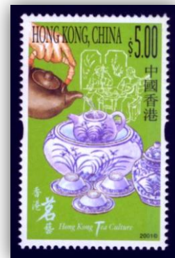
Comment préparer le thé.

Quelques belles porcelaines du XVIIIème siècle.