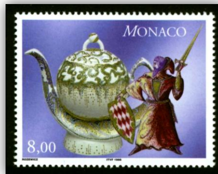
Théière précieuse en porcelaine fine.