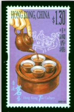
Thé Gongfu - des provinces Fujian et Chaozhou.

La préparation du thé vue par la poste de Hong Kong.